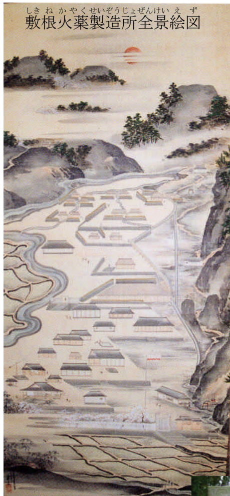
敷根火薬製造所全景絵図