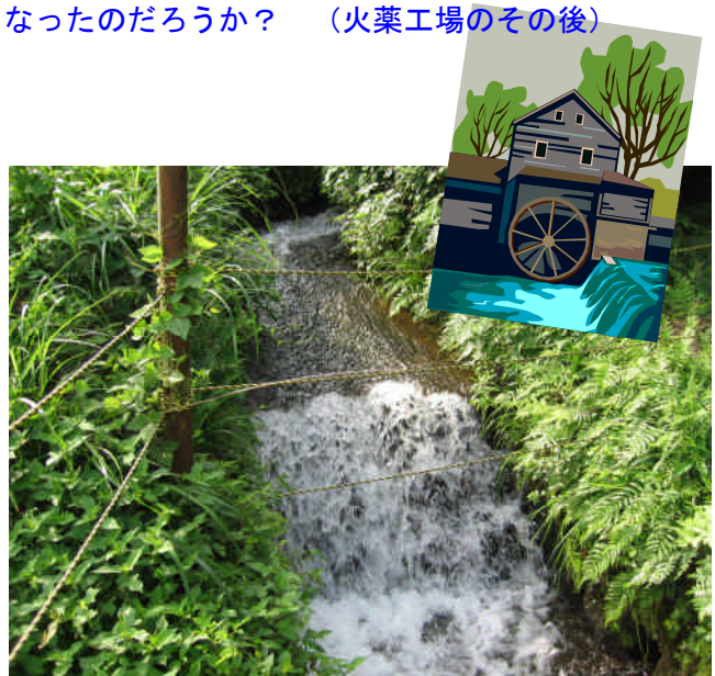
火薬製造に使われた水車小屋の跡