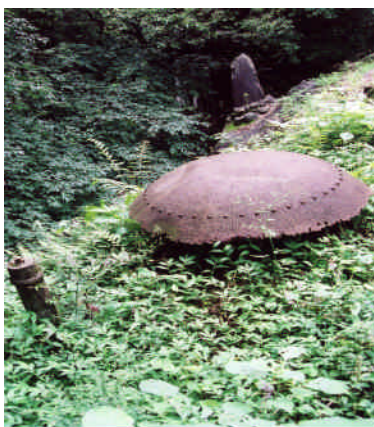
きゅうすいどう すいげんち 旧水道の水源地