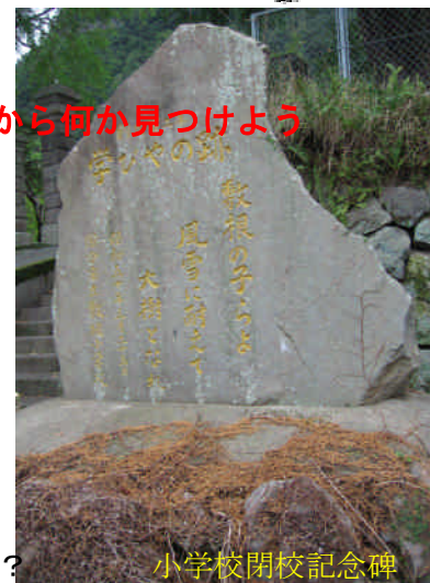
小学校閉校記念碑